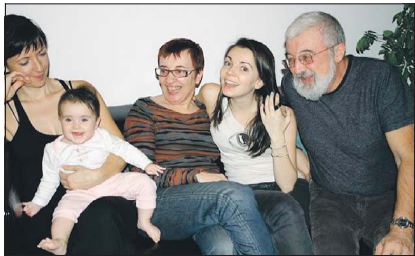
Щастливият татко с шестте си деца през 2009 г. в Мексико