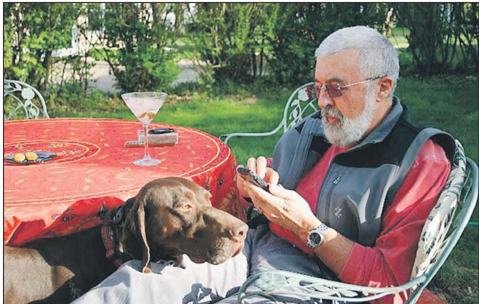
Писателят в градината пред дома си в Айова с любимото си куче